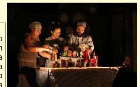
Grupo Nu Escuro - Plural