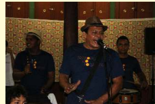
Tambores do Tocantins