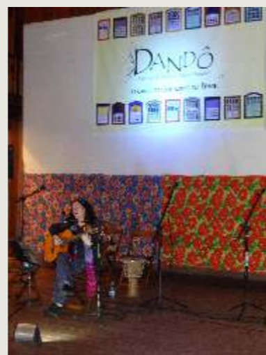
Show com a chilena Tita Parra

Este ano a programação passa a ser bimestral com estreia dia 12 de maio no Cine Pireneus. Anote na agenda!