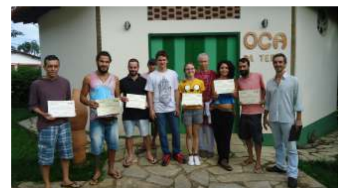
Turma do curso de capacitação de monitores