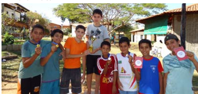
A turminha do infanto-juvenil feliz com a premiação