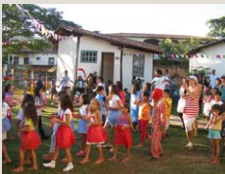
Pastorinhas no cortejo: representação de momento especial da Festa do Divino