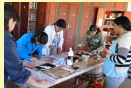
Acima, Preta durante oficina de embalagem e, abaixo, Botega ensina a arte da transformação do barro

Na programação, serão ainda realizadas as oficinas de informática, gestão de negócios, cooperativismo, arte gráfica e criação de uma loja virtual. Este projeto é realizado pela COEPI com recursos do MCT em parceria com prefeitura municipal de Pirenópolis.