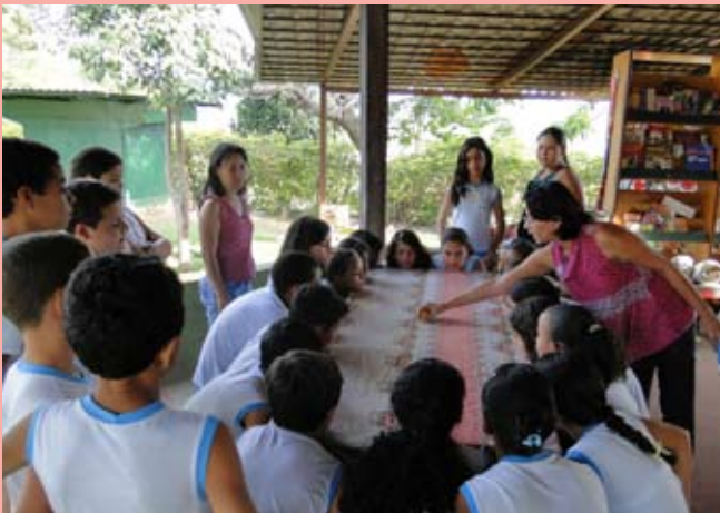
A oficina acontece todas as terças-feiras das 16 às 17h